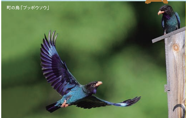
町の鳥「ブッポウソウ」

標高200~500mの高原地帯に位置し、気候は県南と比べると冷涼な空気が感じられます。自然が豊かで森の宝石「ブッポウソウ」の飛来地として、多くの愛鳥家を魅了しています。主な産業は農業で、田園風景が広がり、稲作やピオーネ栽培が盛んです。町内外の会社に勤務しながら兼業農家として農業をされている方や、車での交通アクセスが良いため、都市部に通勤しながら家庭菜園を行うなど、自然と共生して暮らすライフスタイルが定着しています。近年では岡山県が分譲している「吉備高原都市住区」が人気を集めています。