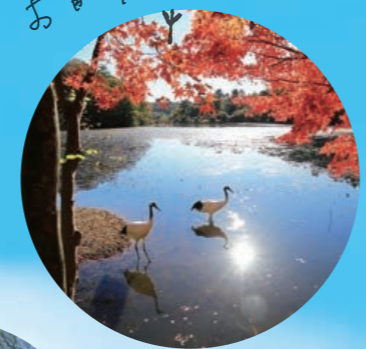
ふら〜っと、 お散歩 ♪♪