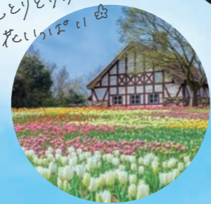
色とりどりの お花畑♪