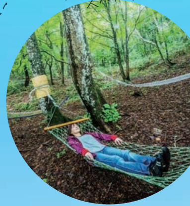
最高の 癒やし スポット!