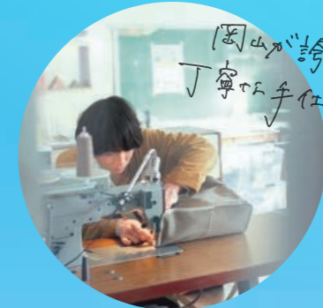
岡山が誇り 丁寧な手仕事〜!