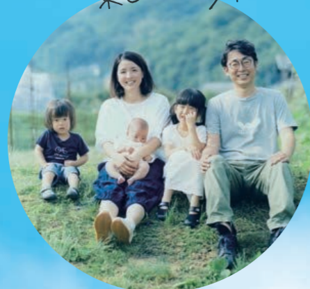
新しい生活、 楽しんでます!