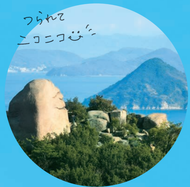
つられて ニコニコ😊