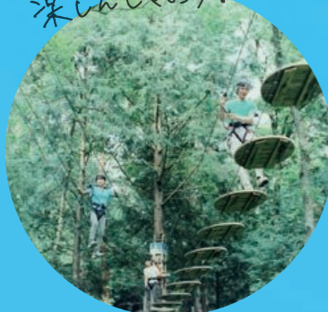
子どもも大人も 楽しんじゃおう!