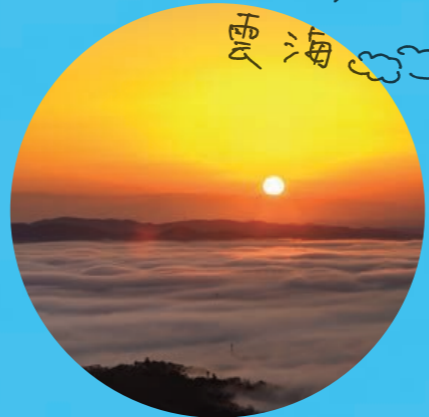
とっておきの 雲海☁️