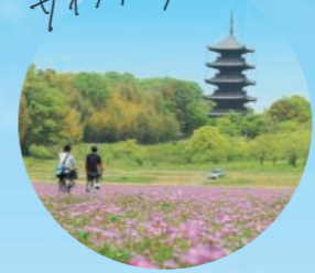
のんびり サイクリング