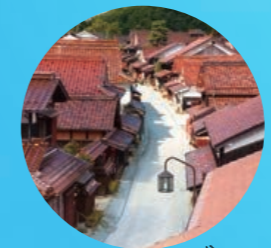
『ジパングレトロ』の 町並み