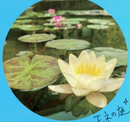
＊王様の庭から届いた 可憐な睡蓮...