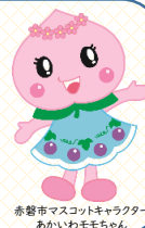
赤磐市マスコットキャラクター あかいわももちゃん