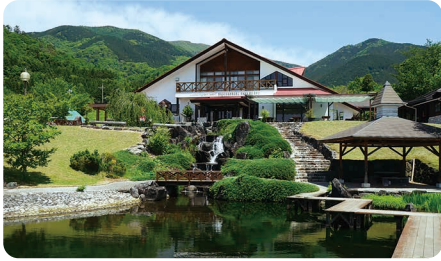
奈義町 / Nagi town

人口約1万1000人の小さい町だが、光回線や上下水道など都市的生活インフラが整備されており、西日本有数の規模を誇る工業団地を有する。高速道路のICもあり、交通のアクセスは良好。ブドウやモモなどの果樹栽培も盛んで、新規就農者の移住もいまさに「ほどよい!田舎」である。