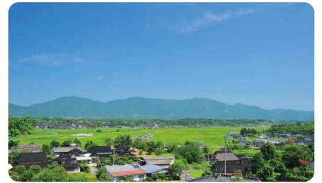
勝央町 / Shoo town

美しい水資源に恵まれた鏡野町は鳥取県との県境に位置している。そよ風と樹木が観られる高原、滝の裏側から流れ落ちる清水が楽しめる滝、美しい景色が広がる湖、美人の湯として名高い温泉、トマトやいちご、ピオーネを始めとした農産物など身体がやわらかい空気で満たされる自然豊かな小さな里山である。