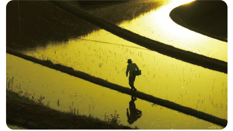
美咲町 / Misaki town

つなぐ棚田遺産に認定された2か所の棚田を有し、昔ながらの田舎風景が広がる農業が盛んなまち。農業体験など自然や人とのつながりを大切にする情操教育を推進するとともに、出産祝い金や入学・卒業祝い金、18歳までの医療費が無料など、子育て支援策が充実。家賃助成などの補助制度あり。