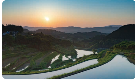
久米南町 / Kumenan town

令和元年度合計特殊出生率2.95の全国有数の子育て支援のまち。出産前から大学卒業までの切れ目ない子育て支援が自慢。奈義町現代美術館をはじめとする文化と、国定公園那岐山が代表する自然にあふれ、自然と文化が豊かな町。(新型コロナウイルス感染症対策においても町独自の緊急地域経済対策給付金を全町民へ配布しているナギギフトカードへ自動チャージするなど、迅速に対応)。