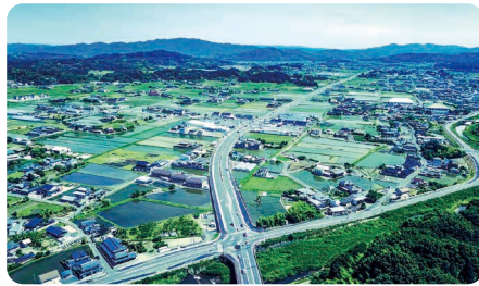
鏡野町 / Kagamino town

人口約10万人で、暮らしに必要なまちの基盤が充実。保育園(所)・幼稚園・認定こども園から高校・高専・大学まで各種教育・保育・医療施設が整い、のびのび安心して子育てが可能。仕事は5000を超える事業所があり、特に製造業は全国有数の技術力を持つ金属・機械産業、木工加工が有名。