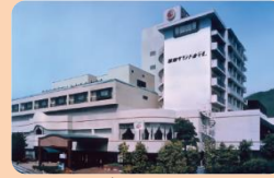
湯郷グランドホテル