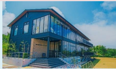
SAND BOX TOTTORI (外観・内観)