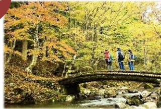
森林セラピー体験