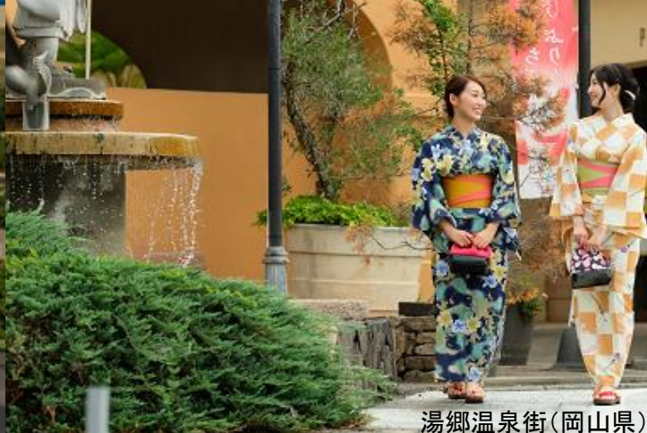
湯郷温泉街(岡山県)

◆貸切バスで、鳥取県智頭エリア・鳥取砂丘周辺と岡山県美作エリアを2泊3日で巡りながら地元起業家との交流会や体験プログラムを行うワーケーションモニターツアー