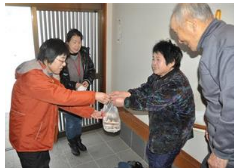
▲買い物支援の様子