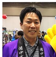
担当 高梁市役所 住もうよ高梁推進課